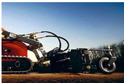
16 Грабли Harley / Harley® Rake