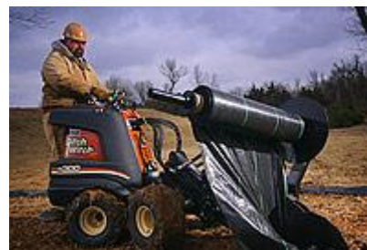
30 Оборудование для установки иловых заграждений / Silt Fence Installer