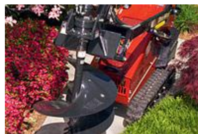
24 Планетарный привод для бура (низкая скорость, высокий крутящий момент) / Planetary Auger Driver (low speed/high torque)