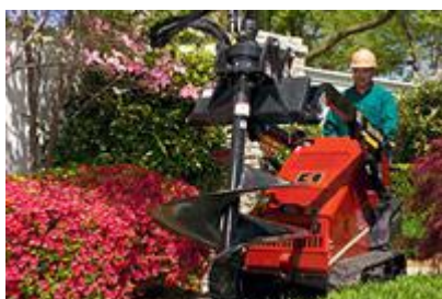
22 Планетарный привод для бура (высокая скорость, низкий крутящий момент) / Planetary Auger Driver (high speed/low torque)