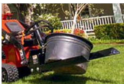
34 Вилы для перевозки деревьев / Tree Fork