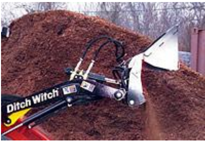
1 Ковш 4 в 1 (44") / 4-in-1 Bucket (44")