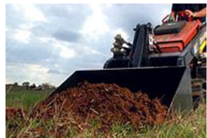
9 Ковш (36") / Bucket (36")