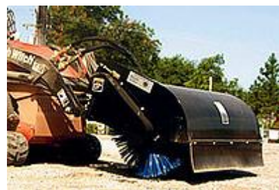
27 Вальцовая щетка / Rotary Broom