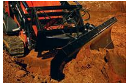
3 Шестиходовой отвал для обратной засыпки (46") / 6-way Backfill Blade (46")