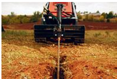
28 Roto Witch®