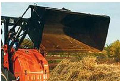
19 Ковш для легких материалов / Light Materials Bucket