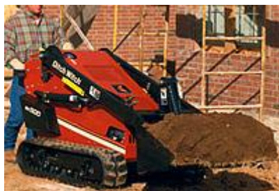
11 Ковш (52") / Bucket (52")