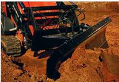
4 Шестиходовой отвал для обратной засыпки (67") / 6-Way Backfill Blade (67")