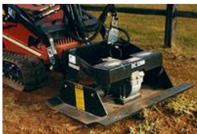
25 Уплотнительный каток / Plate Compactor