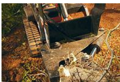
35 Навесное оборудование для срезания кустов / Tree Shear