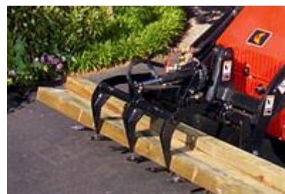
15 Грейферные вилы (когтевой захват) (42") / Grapple Fork (42")