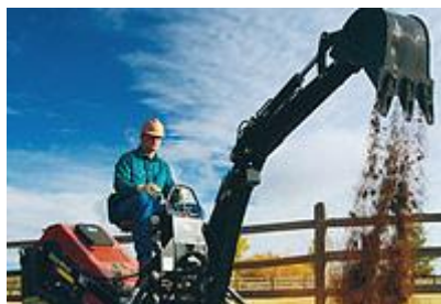
8 Обратная лопата (ковш с обратной лопатой) / Backhoe