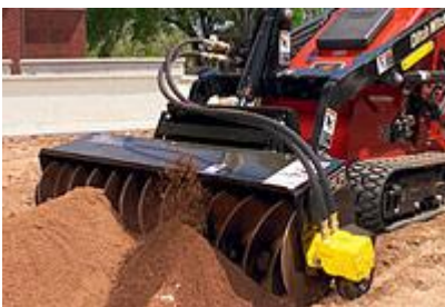
7 Бекфиллер (оборудование для обратной засыпки) (центральный, левый, узкий) / Backfiller (Center, Left, Narrow)