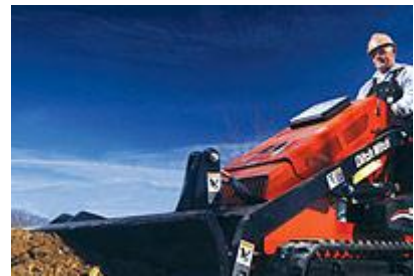
6 Отвал для обратной засыпки (67") / Backfill Blade (67")