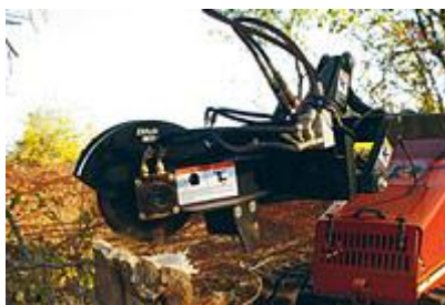
32 Оборудование для измельчения пней / Stump Grinder