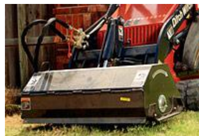
33 Культиватор / Tiller