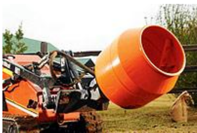
13 Резервуар для цемента / Cement Bowl