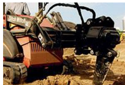
39 Вибраторный плуг / Vibratory Plow

По вопросам приобретения обращайтесь по телефонам +375 29 3298831, +375 29 7762542.