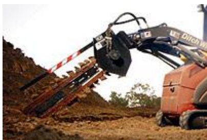
37 Траншеекопатель 30" / Trencher (30")