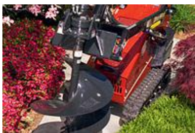
23 Планетарный привод для бура (низкая скорость, высокий крутящий момент) / Planetary Auger Driver (low speed/high torque)