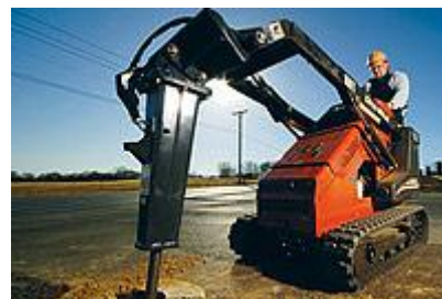
18 Бурильный молоток / Jackhammer