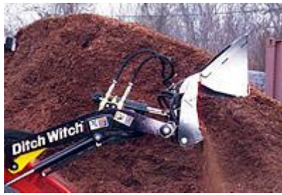
2 Ковш 4 в 1 (52") / 4-in-1 Bucket (52")