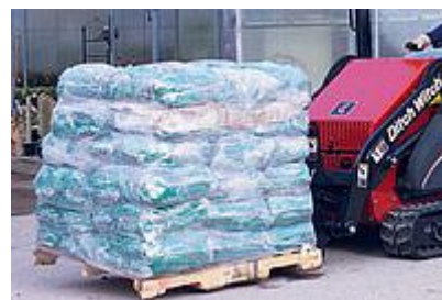
21 Вилы для поддонов / Pallet Fork