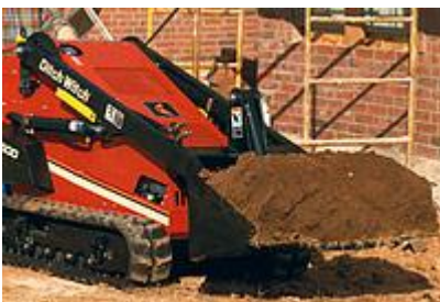
10 Ковш (44") / Bucket (44")