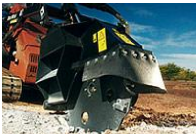
29 Дисковой нож / Saw