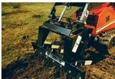
14 Грабли / Grading Rake