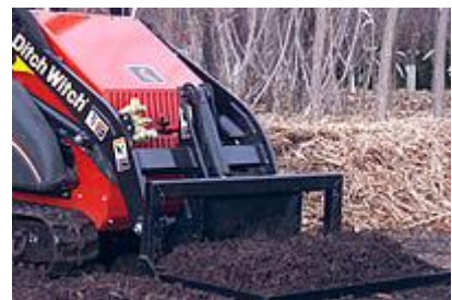
12 Выравнивающая платформа «все в одном» / Carry-All Leveler