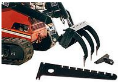
20 Многофункциональное оборудование / Multi-Task Tool