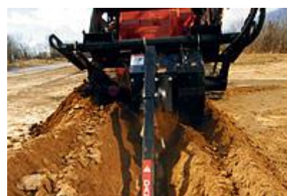
36 Траншеекопатель (24") / Trencher (24")