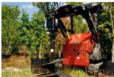
17 Шнек с гидроприводом (высокая скорость, низкий крутящий момент) / Hydraulic Auger Driver (High Speed, Low Torque)