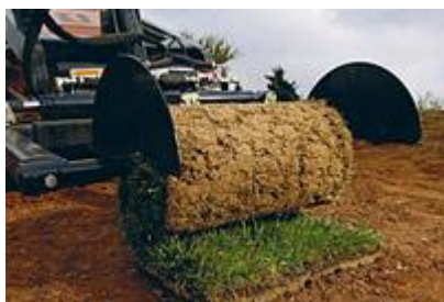
31 Оборудование для укладки дерна / Sod Layer