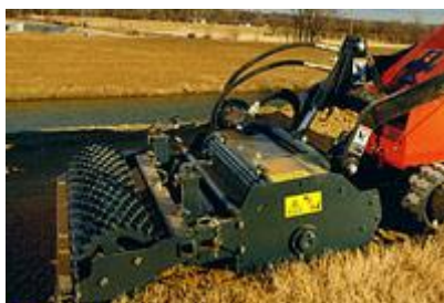
26 Культиватор RotaDairon (сеялка) / RotaDairon® Soil Cultivator