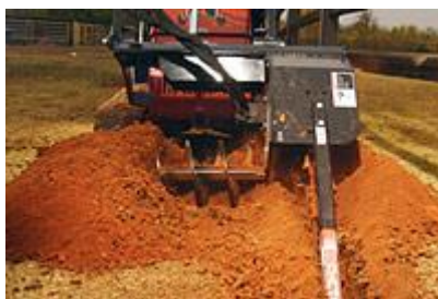
38 Траншеекопатель с широким лезвием / Trencher (Offset Wide)